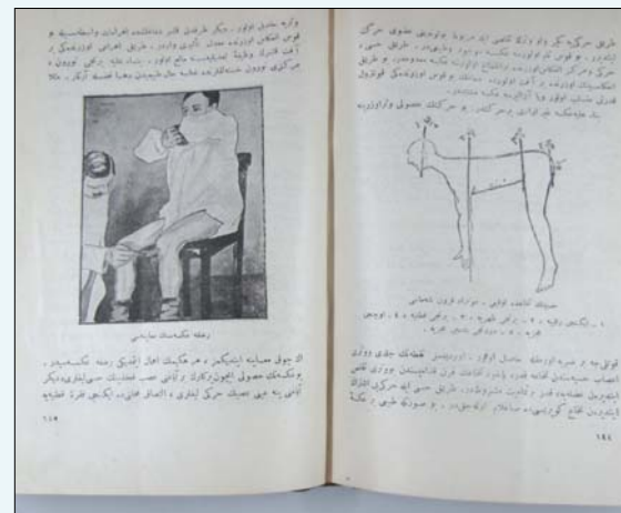
Resim 2. Patella Refleksi Muayenesi