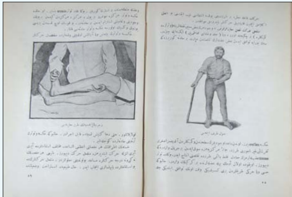
Resim 4. Klonus ve Yürüyüş Muayenesi