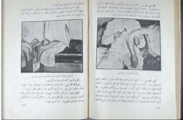
Resim 3. Aşıl ve Triceps Refleksleri Muayenesi