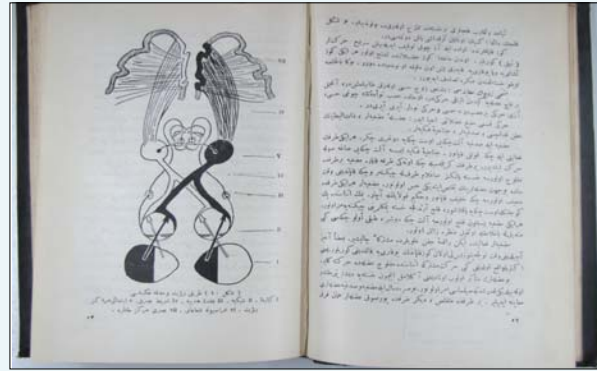
Resim 5. Optik Sinir ve Kiasma