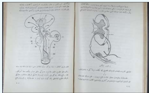
Resim 6. Kafa Çiftleri

Sinir sistemi semiyolojisi özelliği taşıyan bu kitap, nörolojiye giriş kitabıdır. Hepimizin bildiği gibi nörolojik muayene esasında bir lokalizasyon muayenesidir. Geçmişte kapalı bir kutu olan beyinde hastalığın yerini tayin etmek için, periferik sinirlerde ortaya çıkan delilleri değerlendirerek sonuca varılırdı. Bu dün böyleydi. Nörogörüntülemenin en üst düzeyde olduğu bilgisayar çağında, bugün de böyledir. Altın Standart yine nörolojik muayenedir.