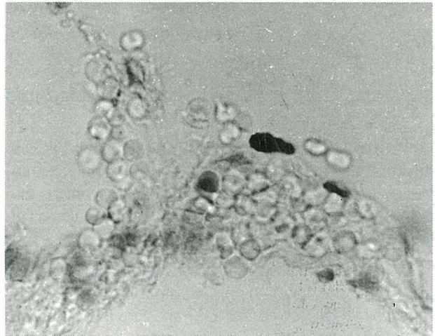
Resim 3: Perivasküler mast hücreleri (X100, TB).

yerleşmiş olduğu, meninkslerde daha çok bulunduğu gösterilmiştir. Vakuölli perisitler olarak adlandırılan beyin mast hücrelerinin daima arteriol ve venüllerle ilişkili olduğu ileri sürülmüş ve damarların özellikle çatallanma yerlerine çok yakın yerleştikleri belirtilmiştir (3).