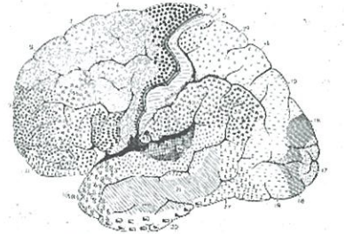
Brodmann'ın Sitoarkitektonik haritalaması

Almanya'da doğdu ve eğitimine devam ederken yaşamını nöroloji ve psikiyatriye adanmasına neden olan Oscar Vogt (1870-1959)'tan etkilendi. Ancak 1900-1901 yıllarında Brodmann, kendisinin yaşamı boyunca nöronatomi alanında çalışmaya başlamasına neden olan Alois Alzheimer (1864-1915) ile tanıştı. Brodmann günümüzün memeli korteksinin karşılaştırmalı sitoarkitektoniği biliminin temelini atmaktan sorumludur. Beyin alanı terminolojisindeki tüm karmaşa, Brodmann'ın katkısıyla ortadan kaybolmuştur.