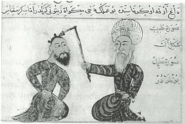
Şekil 2. Epilepside dağlama tedavisi

"Sara balgamdan olursa sakinleştirici kullan (eğer hasta büyük ise ilaç kullanmaya uygun olursa). Eğer hasta küçük çocuksa ona gargara otları ver, onu çiğneyip suyunu yutsun. Eğer rahatlamazsa hastanın başının ortasını dağla, bir dağ ense ve 2 dağ boynuz yerine vurasın, eğer dayanırsa 3 dağ boyun omurgasına, 4 dağ da arka omurgasına vurasın" (Şekil 2).