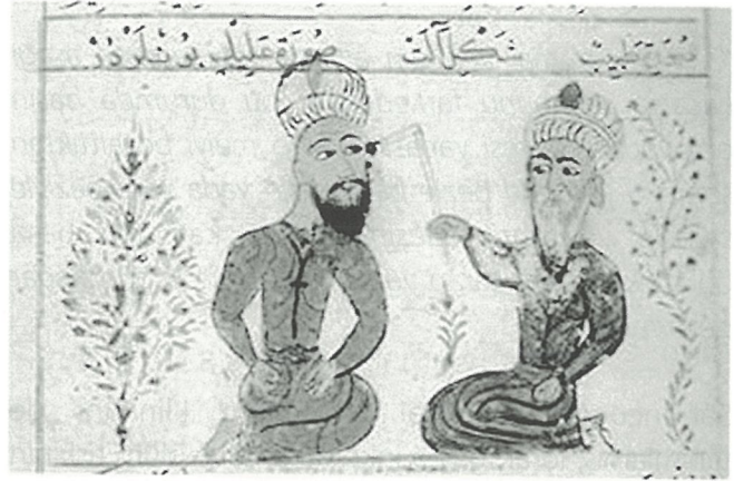
Şekil 3. Başağrısında dağlama tedavisi

-Hastanın şakaklarındaki saç kesesin, atardamarı bulasın, kanın akış hareketi doğrultusunda (ama soğukta bazı kişilerde bulamazsın) o zaman hastanın başını bir bezle bağla ve o bölgeye bez sür ya da su dök ki damar görülsün. O zaman neşteri al..." (Şekil 3).